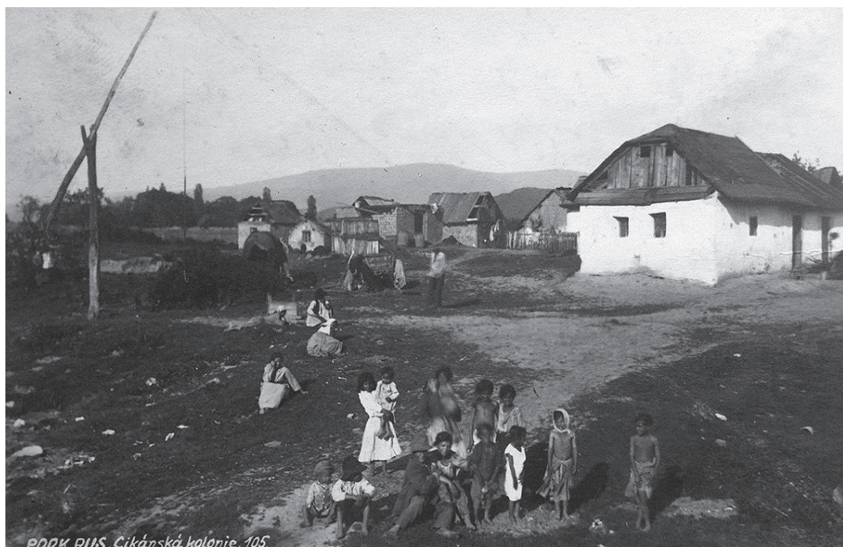
РРР, РУС. Cikánská kolonie. 105.