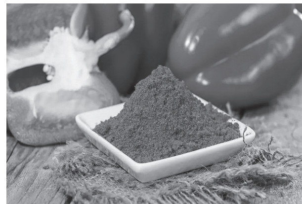
Паприка для здоров'я та молодості

Насичений червоний колір, витончений смак та велика кількість корисних вітамінів – це все про паприку. Ця спеція виготовлена зі стиглого червоного перцю слабопекучих сортів, і є однією з найулюбленіших приправ кухарів у всьому світі. А ще вона дуже корисна для організму, оскільки здатна його омолодити та підтримати міцне здоров'я.