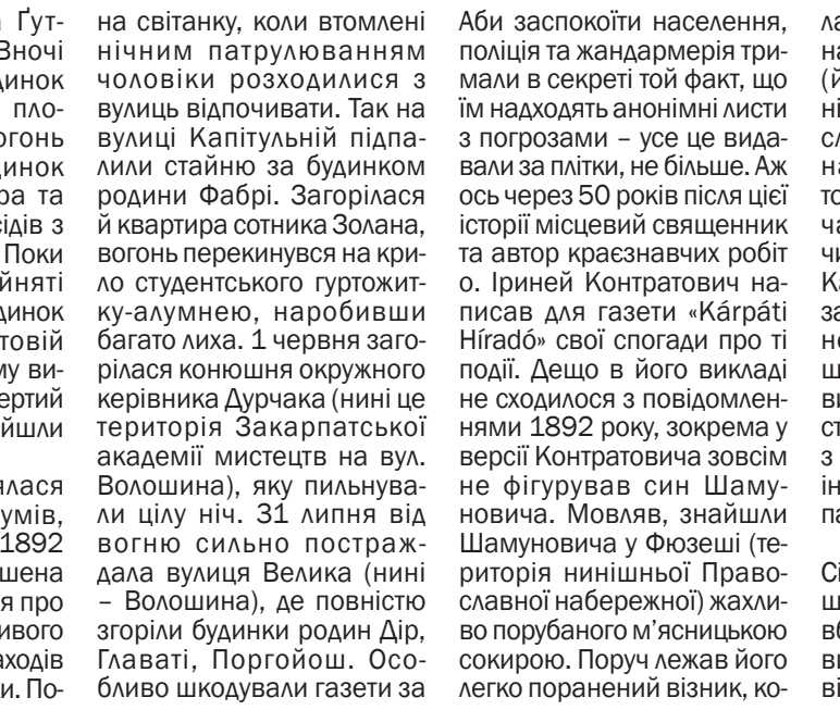
UZHGOROD V ROCE 1892. - UNGVÁR 1892-BEN. - УЖГОРОДЪ ВЪ 1892 ГС

старовинним будинком родини Дір (на жаль, поки не вдалося з'ясувати, про яку будівлю йшлося). Загалом за травень-червень 1892 року в місті сталося більше 10 пожеж, які лише дивом