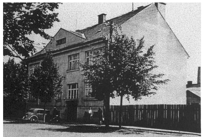
Будинок на вулиці Руській

го танцю, так що вдома просто падав із ніг. Він ніколи не вживав алкоголю, був дуже доброзичливим і понад усе любив товариство. Мабуть, саме цей життєвий оптимізм допоміг йому пережити втрату майна і своїх статків. Олексій Бескид перші кілька років у Стрпкові жив дуже бідно, та ніколи не скаржився на життя, був завжди добрим і усміхненим.