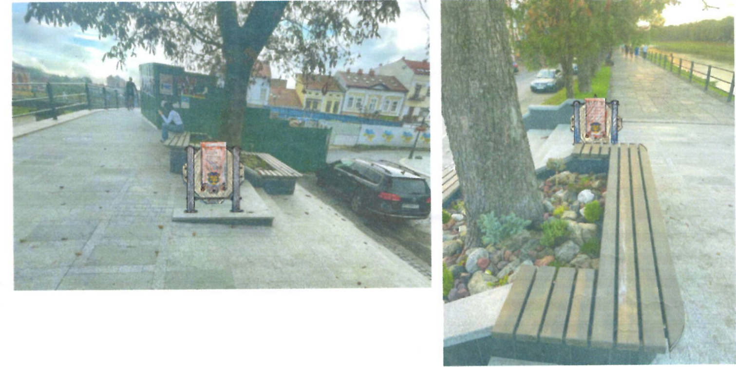
Фото-візуалізація розміщення міні скульптури