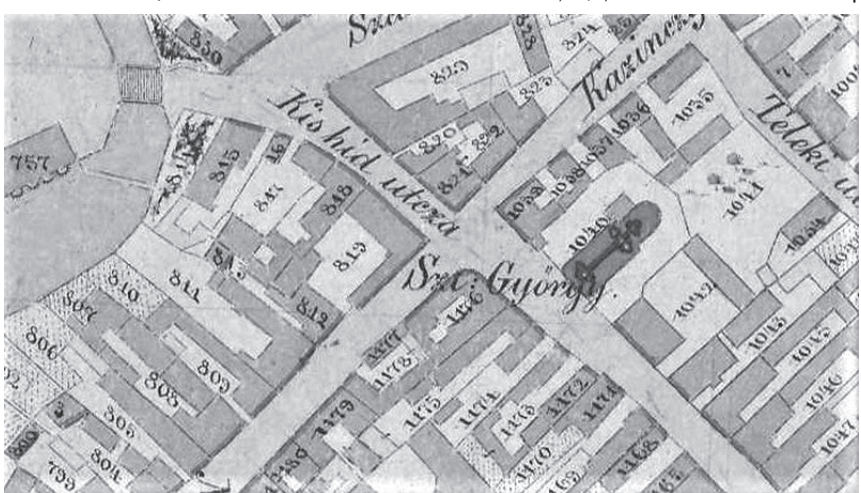
Карта Ужгорода XIX століття, номером 819 позначена територія корчми «Білий корабель»