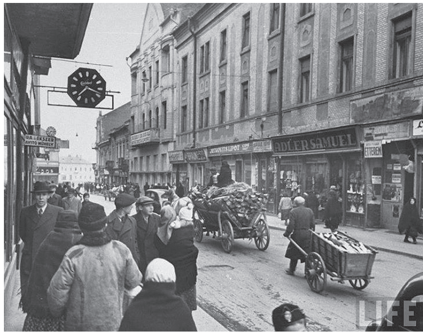
«Білий корабель» у 1939 році

Багато хто з мешканців будинку проживав там роками – ще з часу його зведення. У 1925 році вибухнув справжній скандал, викликаний тим, що «старожили» збунтувалися проти нових розцінок на оренду, які встановила міська управа. Газета «Uj Közlöny» писала, що в «Білому кораблі» живуть небагаті люди, а їм нараховували такі ціни, ніби вони мільйонери. «Чотирикімнатні квартири в Малому Галагові можна винайняти за 2400-3000 корун (мабуть, ідеться про вартість річної оренди), за 16 тисяч пошта орендує два поверхи будівлі (мається на увазі тодішня будівля пошти навпроти Жупанату), за 36 тисяч можна орендувати всю будівлю "Корони", – повідомляли тоді в газеті, порівнюючи з тим, що в «Білому кораблі» вартість квартир оцінено в 4-8 тисяч