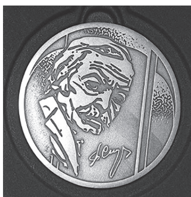
Висунення кандидатур на здобуття Премії проводиться колективами творчих спілок, ор-

як правило, літератори та краєзнавці, які народилися, проживали або тривалий час працювали в Ужгороді та на території Закарпаття.