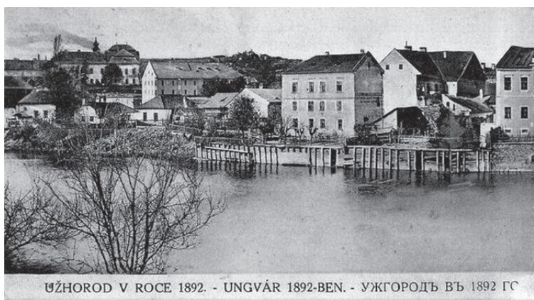
UŽHOROD V ROCE 1892. - UNGVÁR 1892-BEN. - УЖГОРОДЪ ВЪ 1892 ГС

часто навіть важко зорієнтуватися і зрозуміти, що вони бачать. Орієнтиром тут може служити триповерхова будівля в центрі фото, на першому поверсі якої тепер працює «Майстерня шоколаду». Вона єдина з ряду тамтешніх споруд збереглася до наших днів.