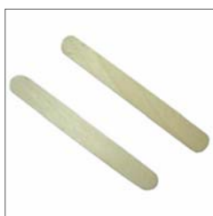
Зразок шпателя для язика

3) Шпатель для язика (для взяття мазків із зіву).