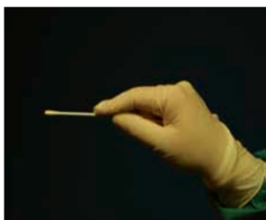
Мал. 2. Паличка з тампоном взята неправильно