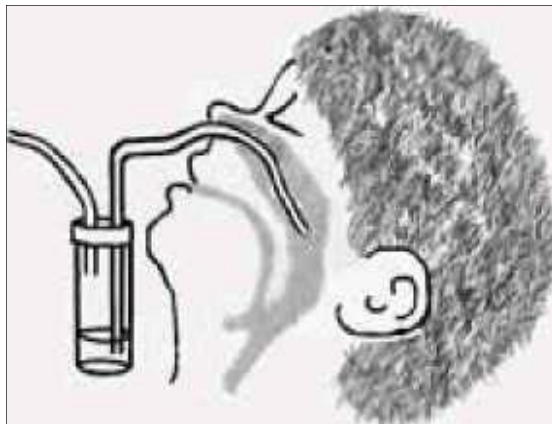
Мал. 5. Взяття фарингального аспірату