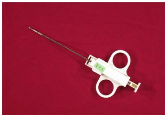
Мал. 6. Біопсійна голка для відбору зразків секційних матеріалів