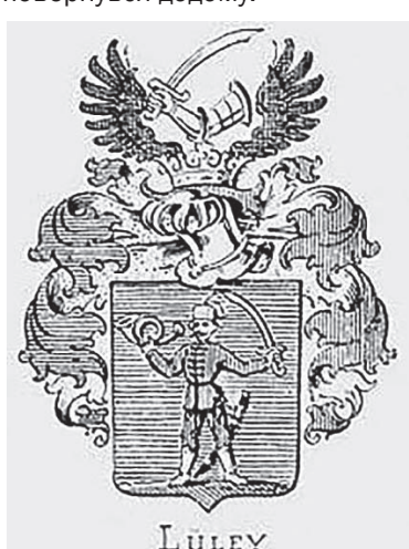
Герб родини Люлеї

Шандор Люлеї (Lüley Sándor) народився в Минаї 1865 року. У 1883-му закінчив Унґварську королівську католицьку гімназію, де був активістом товариства імені Габора Дойка. Далі поїхав на навчання до Будапешта – вступив на юридичний факультет Будапештського університету. Диплом Шандор Люлеї отримав у 1887 році, після чого, ймовірно, повернувся додому.