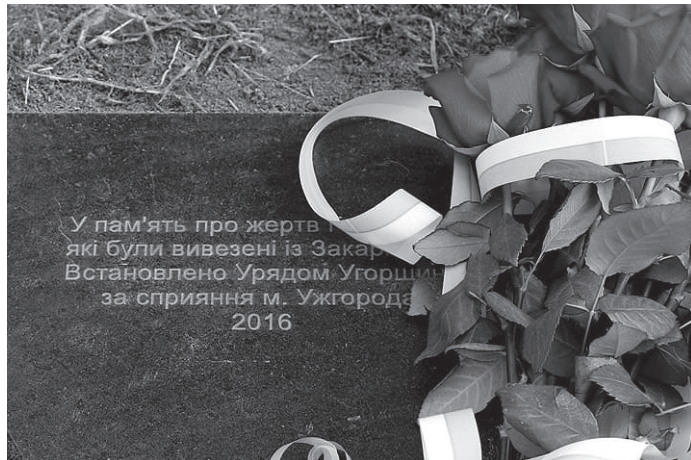
Андрійв, інші посадовці, представники єврейської громади поклали квіти до пам'ятного знака і запалили лампадки.

Бабин Яр став братською могилою і символом Голокосту в Україні. Від вересня 1941 року до кінця вересня 1943-го нацисти регулярно розстрілювали і захоронювали там євреїв, ромів, радянських військовополонених, українських націоналістів, пацієнтів київської психіатричної лікарні, в'язнів Сирецького табору – загалом усіх тих, кого гітлерівці вважали ворогами. Жертвами стали понад 100 тисяч цивільних громадян та військовополонених.