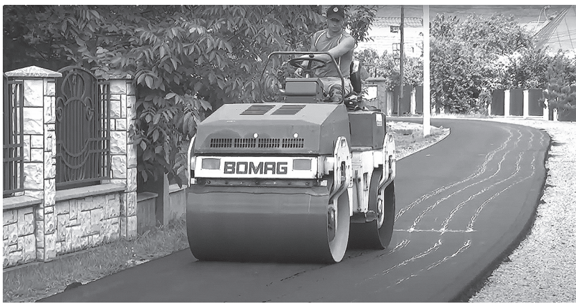
Цього тижня завершено капітальний ремонт ще однієї ужгородської вулиці – Стародоманинської.