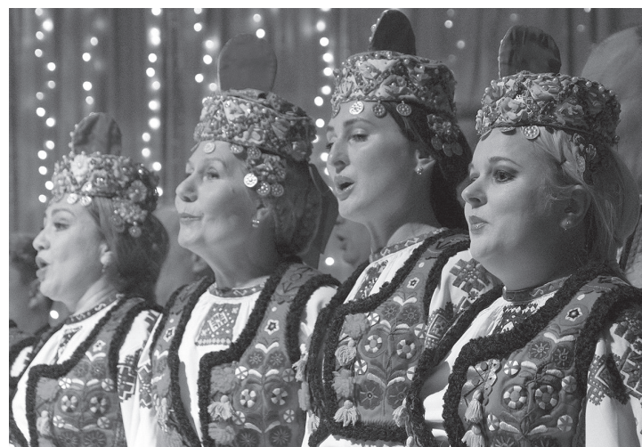
"Курінець" на сцені філармонії обмінялися прапорами