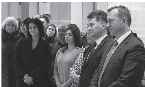
Мукачівської греко-католицької єпархії.

Того самого дня колектив Ужгородської міської ради вітали з Різдвом Христовим священнослужителі Тячівського, Дубівського і Рахівського деканатів