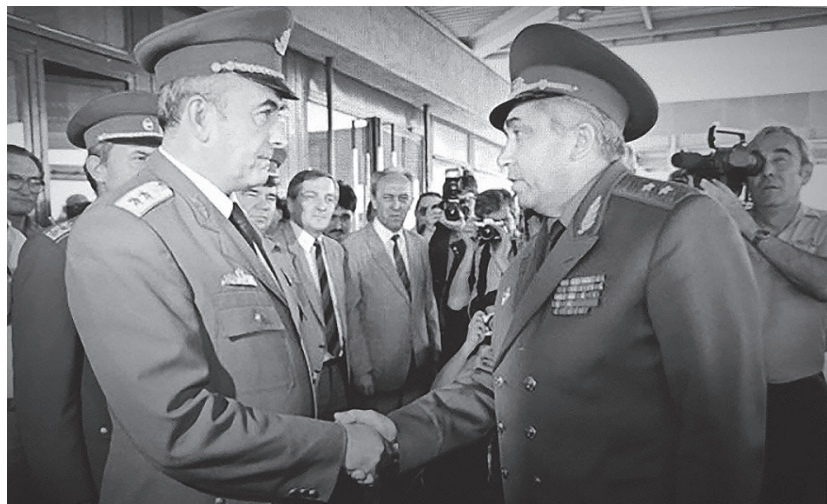
Генерал Шилов (з правого боку) прощається на кордоні з угорськими колегами

у Придністров'ї. Там генерал зазнав важкого поранення в ногу, цілий рік пролежав у лікарнях, змагаючи від сильного болю, який спричиняв апарат лізарова. З лікарні виїшов на милицях. Оскільки служити більше не міг, звільнився з армії. Тоді генерал міг обрати будь-яке місто для проживання. Він приїхав на Закарпаття. Каже, що колись почув таку пораду: «Хочеш бути щасливим – живи в Україні. Хочеш бути здоровим – живи на Закарпатті». Ось і прибув він із дружиною й дітьми до нашого краю, оселився в Оноківцях. Згадує, що почав будувати житло в чистому полі, – нині ж навколо вже облаштоване містечко. Поряд із новою домівкою збудував генерал невеликий готель – тож можна сказати, що в Оноківцях туристів приймає не просто готельєр, а останній із радянських командувачів військовими групами, генерал, котрий виводив радянських солдатів з Угорщини.