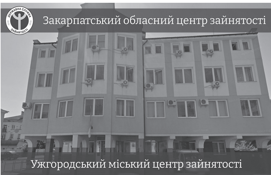
Ужгородський міський центр зайнятості

заробітної плати, що склався у відповідному регіоні за минулий місяць) тривалістю, не більшою ніж 6 календарних місяців, надається за умови працевлаштування зареєстрованих безробітних із числа ВПО за направленням базового центру зайнятості на умовах строкових трудових договорів і збереження гарантій зайнятості таких осіб упродовж періоду, що перевищує тривалість виплати у 2 рази.