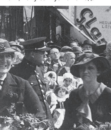
Едвард Бенеш та Антонін Розсіпал біля готелю «Корона», 1934 рік.

По короткому відпочинку Едвард Бенеш мав зустріч із місцевими журналістами. Його знову запитували, чому затягується з наданням