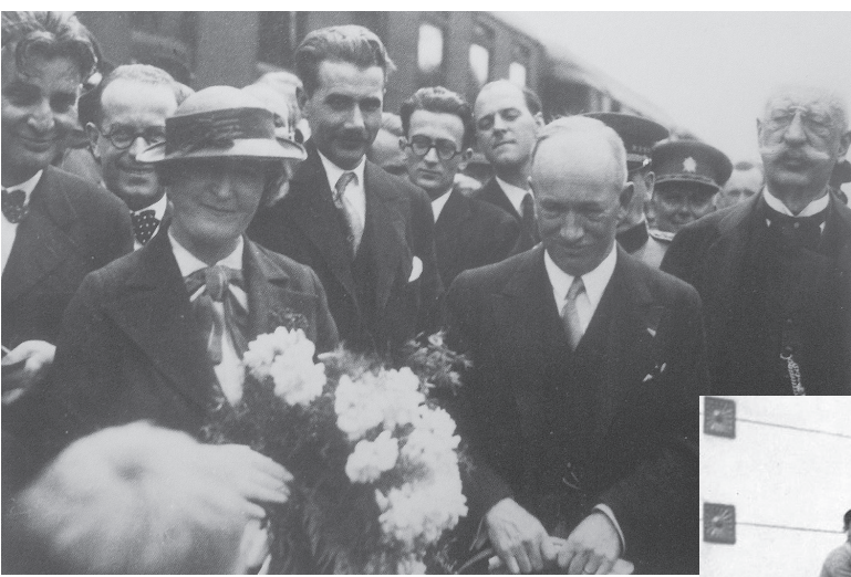
Едвард і Гана Бенеші на ужгородському вокзалі під час візиту 1934 року.

Уперше Едвард Бенеш приїхав до Ужгорода в статусі прем'єр-міністра Чехословаччини 30 грудня 1921 року. На жаль, нам не вдалося знайти світлини щодо цієї події, не писала місцева преса і про