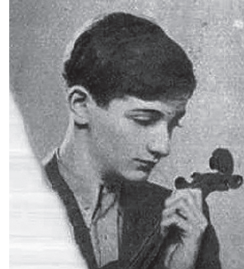
Фото – «Képes Pesti Hírlap», 1937

уже німецькою мовою). Львів Лоцику дуже сподобався, незважаючи на те, що він мусив поєднувати навчання у школі з заняттями у викладача Львівської музичної академії Байєра (на жаль, мені не вдалося знайти інформацію про такого викладача, щодо закладу теж не зовсім усе зрозуміло, адже у Львові в той час працювали Музичний інститут і консерваторія, а не академія). Додому талановита дитина теж час від часу приїздила й навіть давала тут концерти, зокрема, з великим успіхом виступила з оркестром 66 піхотного полку (його очільник генерал Прхала нібито був настільки вражений талантом хлопчика, що подарував йому іменний золотий годинник). У 1931 році