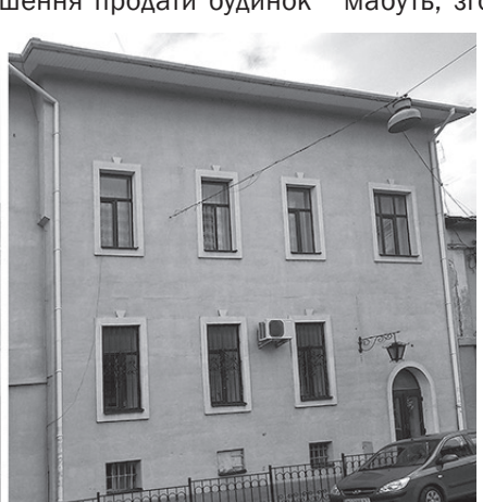
Історична будівля міської поліції на початку 1990-х років і нині (перше фото – з альбому «Архітектурна спадщина Ужгорода» П.Сарваша)