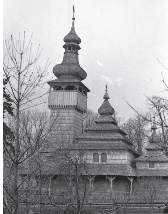
Шелестівська церква в Ужгородському скансені, 1978 рік