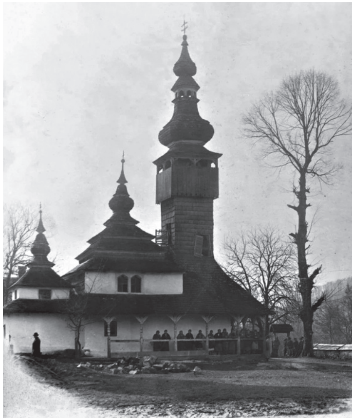
Церква Св. Арх. Михаїла у селі Шелестово, 1920-ті рр.

з дубових брусів, скріплених в кутах замками «ластівчин хвіст». Висота церкви з вежею сягає 22 метри".