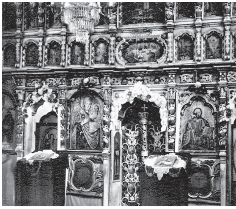
Іконостас Шелестівської церкви на листівці 1939 року