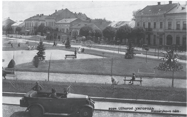
Площа Масарика

городиною, перенесли на вулицю Бозош (Толстого), там же розмістили торговців домашньою птицею та вуличною їжею. Торговці посудом та іншим неїстівним крамом знайшли місце в кутку площі від будівлі фінансового уряду (нинішньої ЗОШ № 9) до вулиці Митрака. Столики м'ясників розмістили на початку вулиці Капушанської, продавцям тканини й одягу, кравцям надали місце на Кожелузькій