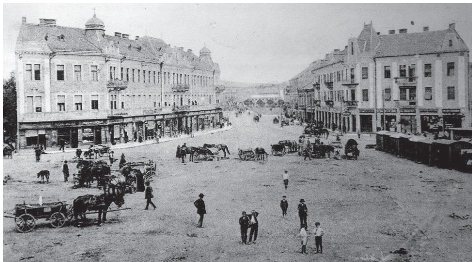
міста значно охайнішою.

Місцеві торговці й самі розуміли, що парк там виглядатиме куди краще, ніж