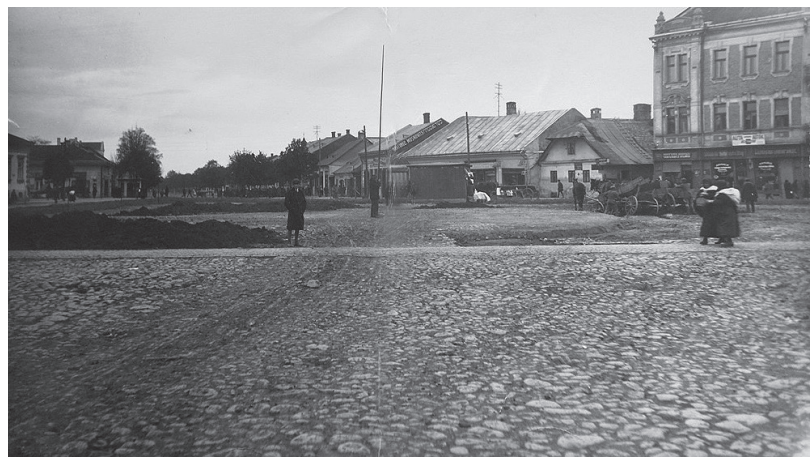
Початок робіт на пл. Масарика з видом на тодішню вулицю Бозош (нині – Толстого), фото – з фондів Закарпатського обласного краєзнавчого музею ім. Т. Легоцького

ли велику кількість гостей на Першу промислову виставку Підкарпатської Русі – грандіозне дійство, під час якого містові хотілося показати себе у всій красі. Площа Масарика лежала якраз на шляху гостей