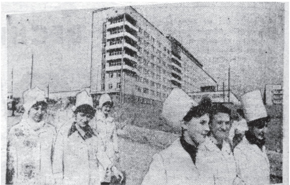
Напередодні першотравневого свята в обласному центрі стала до ладу новозведена міська лікарня. Ключі від неї медперсоналу вручили кращі будівельники БУ «Промжитлобуд» тресту «Закарпатбуд».