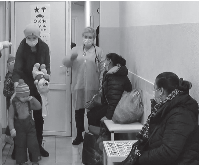
Початок на стор. 1.

Те, що 10 років тому ідея створити Ужгородський міський центр ПМСД переросла в рішення – є одним із кращих соціальних результатів для нашої територіальної громади. Дякуємо Вам, шановні медики, що піклуєтесь про здоров'я ужгородців! – Рівно 10 років тому, 3 березня 2014 року, офі-