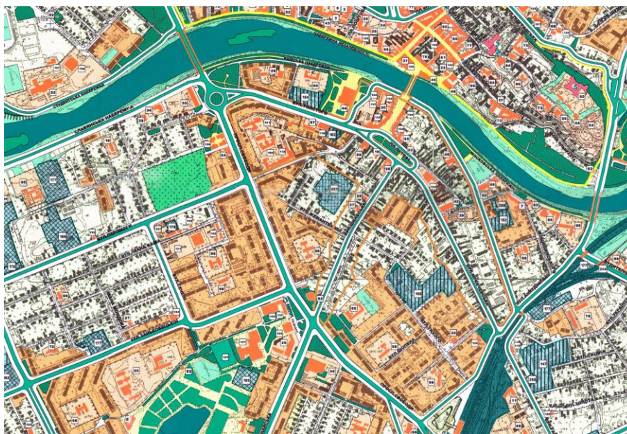
Рис. 1 – Вкопювання з діючого генерального плану міста Ужгорода

В рамках проведення процедури Стратегічної екологічної оцінки проекту Оголошення про розміщення даної Заяви на офіційному веб-сайті було опубліковане у друкованих засобах масової інформації. Протягом громадського обговорення заяви про визначення обсягу стратегічної екологічної оцінки (15 календарних днів) зауваження та пропозиції від громадськості не надходили. Заяву Про визначення обсягу стратегічної екологічної оцінки документу державного планування було надіслано органам виконавчої влади, що реалізують державну політику у сфері охорони навколишнього природного середовища та у сфері охорони здоров'я.