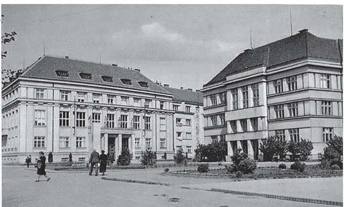
Здание Аграрного банка в Ужгородѣ.

На той час для потреб філіалу головного «Народного банку Чехословенська» ще не була зведена будівля в Малому Галагові (нині будівля територіального управління Рахункової палати в Закарпатській області в сквері Лаборця, тобто на колишній площі Пушкіна), тож він розміщувався на площі Корятовича, 23. Переїхала установа в нову масивну