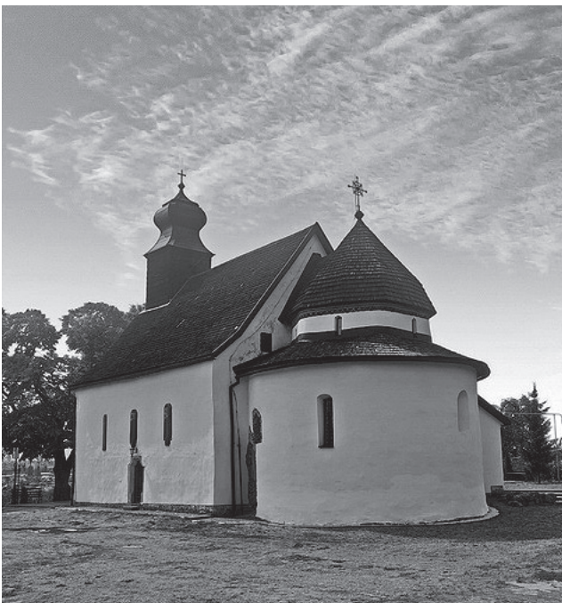
Відбудеться також панахида за загиблими Героями. Початок о 10:30. Усіх запрошує Заслужений академічний Закарпатський народний хор.