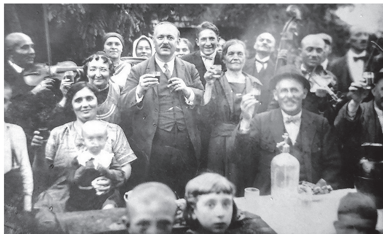
Сюрет на ужгородських виноградниках Ланди

для себе. Вони зрозуміли, що на цьому можна добре заробити, тому збільшували площі насаджень, закупляли професійні вдосконалені преси, а відповідно до збору урожаю підходили не як до родинного свята, а як до промислової потреби. Все більше на зборах працювали