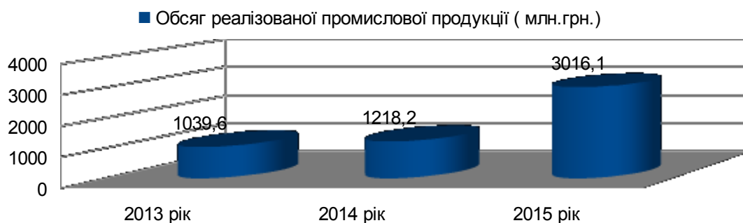
Динаміка обсягу реалізації промислової продукції м.Ужгорода 2013-2015 р., (млн.грн.)

Упродовж січня-грудня 2015р. підприємствами міста реалізовано промислової продукції на суму 3016,1 млн.грн., що склало 21,7 відс. обсягу реалізації промисловості області. Близько 28 відс. реалізації промислової продукції припадає за межі України.