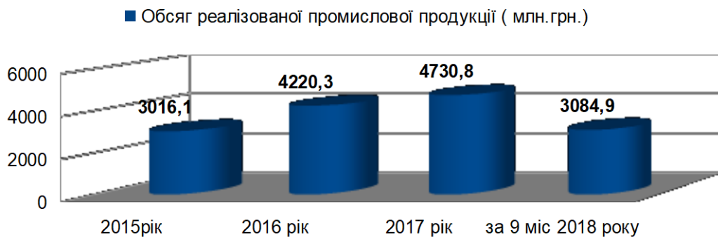
Динаміка обсягу реалізації промислової продукції м.Ужгорода за 2015-2017 р.р., та 9міс 2018 року (млн.грн.)

У загальному обсязі реалізованої промислової продукції: добувна та переробна промисловість складає - 41,9 відс., енергія - 40,4 відс., 8,3 відс. - інвестиційні товари та 9,4 відс. - займають товари проміжного споживання.